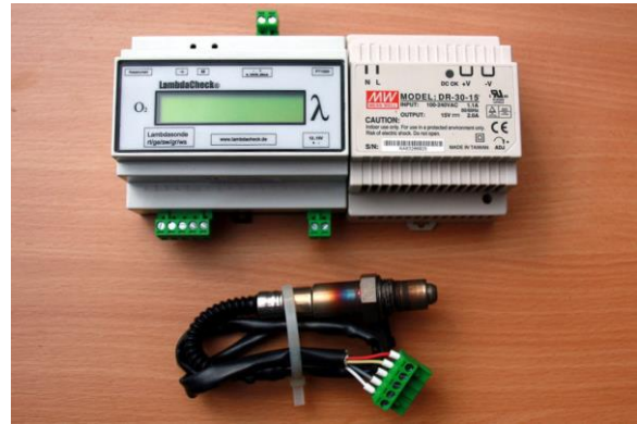
Bild2 Komplettsatz ohne Zubehör

In Bild1 ist das Modul abgebildet. Es ist hier auf einer DIN-Schiene montiert.